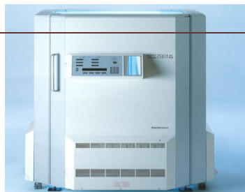
کمیته آموزش پرستاری و پزشکی